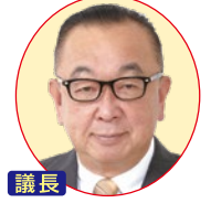
議長 奥村 芳正(5) おくむら よしまさ 土木交通・警察・企業常任委員会