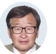
副議長 有村 國俊(4) ありむら くにとし 環境・農水常任委員会