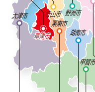
田中 英樹(1) たなか ひでき 教育・文化スポーツ常任委員会 琵琶湖・GX推進対策特別委員会