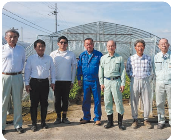
北山田にて害虫生け捕り一斉防除に参加しました(6月1日)